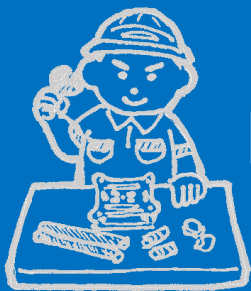
ステップ1 組み立て